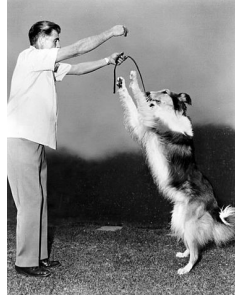
愛玩動物飼育管理士 第Ⅷ編 動物のしつけ